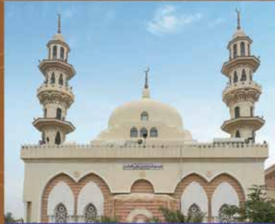
مسجد عيسى عبدالله العثمان